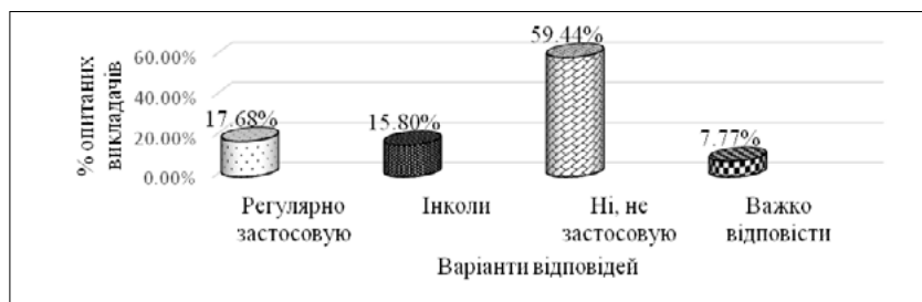
Рис. 3. Відповіді викладачів щодо створення STEAM-освітнього середовища у закладі вищої освіти, (%)

За допомогою анкетування ми спробували визначити, чи спрямовують свої зусилля викладачі на оновлення освітнього середовища закладу вищої освіти для забезпечення формування професійної мобільності майбутніх учителів фізичної культури; які інноваційні форми навчання, поряд із традиційними, використовують викладачі у роботі зі студентами. Респондентам пропонувалося надати відповіді щодо застосування поряд з традиційними формами навчання таких форми, як інтегровані STEAM-проекти, кейс-метод, проблемно-ігрові методи з моделюючим ефектом, бінарні-лекції-диспути (дебати), дуальні форми з використанням фребель-педагогіки та оздоровчо-театральна педагогіка та ін.