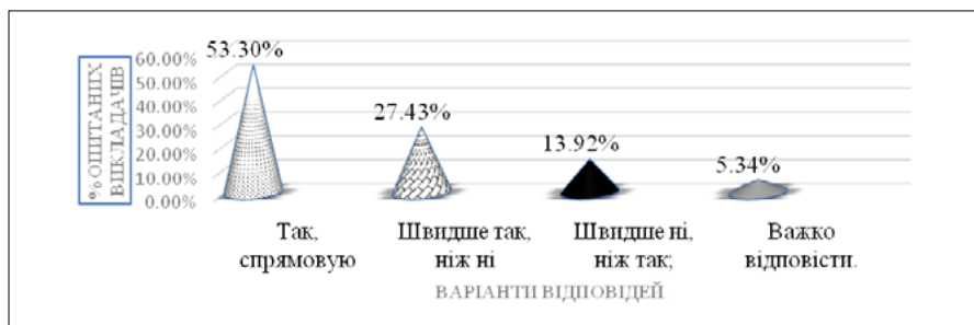
Рис. 2. Відповіді викладачів, опитаних щодо формування професійної мобільності в умовах закладу вищої освіти, (%)

рення STEAM-середовища. Ми отримали наступні результати: 53,30% респондентів вважають, що так; ще 27,43% – швидше так, ніж ні; 13,92% – швидше ні, ніж так та 5,34% – не змогли відповісти (рис. 2).